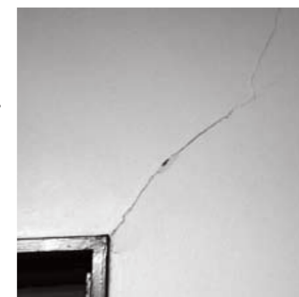
3月11日の大地震による梁等の亀裂