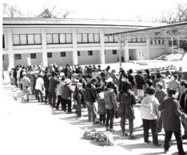
当日は好天に恵まれ、大勢の住民の皆様が参加しました

ムに分かれて競争しました。水を入れたバケツを2列に並んで次々に受け渡し、大きなポリ容器を先にいっぱいにしたチームが勝ちです。この日初めて知り合った人も多いチームですが、負けるものと皆さん真剣そのもの。約3時間にわたる訓練の最期を盛り上げました。