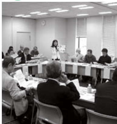
第2回理事長連絡会の様子

2月26日(土)千代田区役所で「第2回千代田区マンション理事長連絡会」が開催されました。会議には22名の理事長の皆さんが参加し、マンションと地域町会とのコミュニティ関連として、マンションのオートロックの問題、地域行事への参加、大切な居住者名簿について意見が交わされました。また理事長連絡会加入条件について、皆さまからのご意見を踏まえ、理事長であれば加入できることとしました。