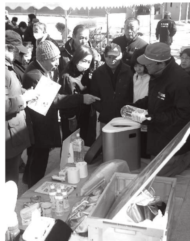
様々な防災グッズの紹介コーナー

政府の地震調査研究推進本部は、今後30年以内に南関東でマグニチュード7程度の地震が発生する確率は70%と発表しています。町内会やマンションの管理組合が協力して地震への備えをさらに強化することが必要です。