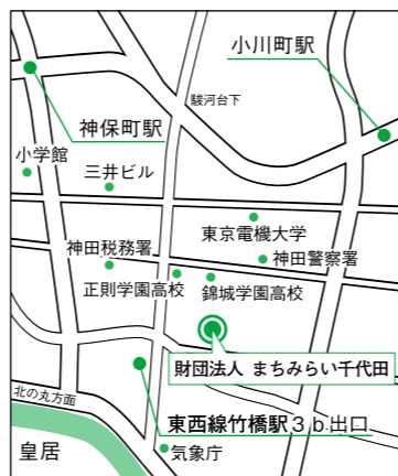
ちよだプラットフォームスクエア周辺案内図

◇お問い合わせ・ご予約 住宅まちづくりグループ TEL 03-3233-3223