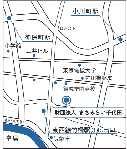
ちよだプラットフォームスクウェア周辺案内図

◆お問い合わせ・ご予約 住宅まちづくりグループ TEL 03-3233-3223