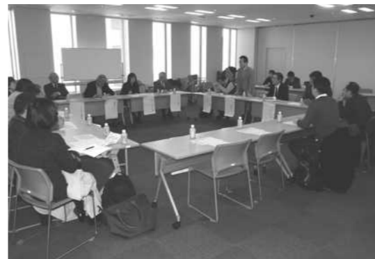
理事長さん同士の交流も

意見交換では、管理組合が所有する駐車場の空き問題により苦労しているとの発言がありました。その他、管理組合の役員のみならず長く役員を続けている方もおり、マンションにより事情が異なるものの、様々な課題を抱えていることを感じます。理事長連絡会では参加理事長間での話し合いで課題解決の糸口が見つかることを願うとともに、内容によっては、財団から専門家の派遣を行う等の工夫もしていきたいと考えています。