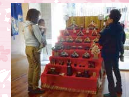
お子様の健やかな成長への願いも込められたお雛様