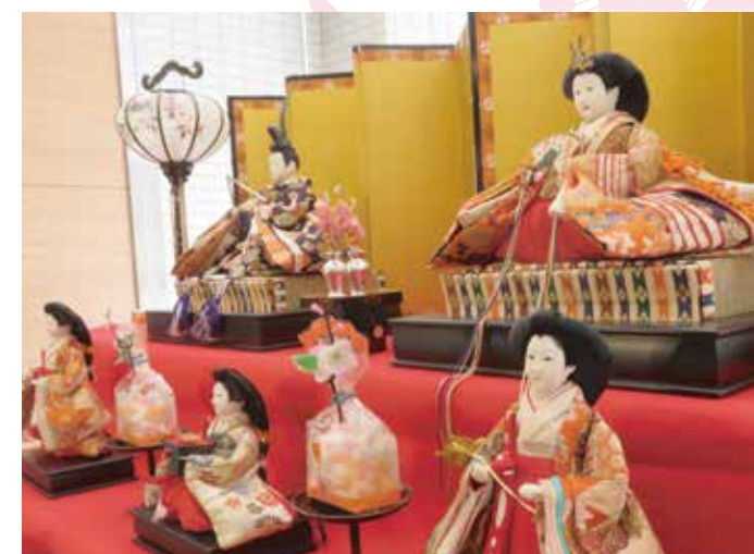
豪華なお雛様の飾りに、つい寄ってみたいくなります