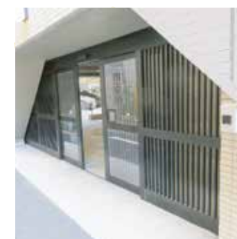
裏口のドアも自動ドア化