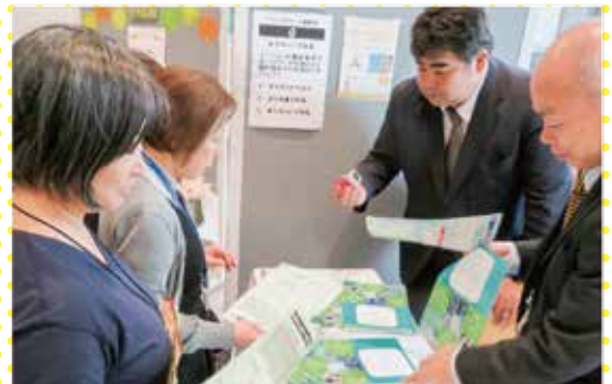
まちなみらい千代田のブース(くらしの広場)