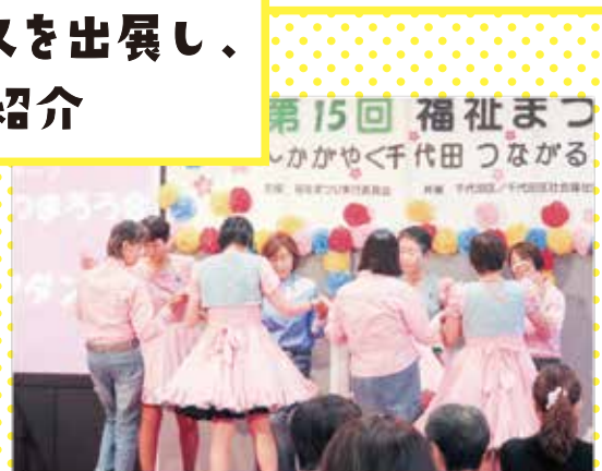
壇上でスクエアダンスを披露する皆さん(福祉まつり)

両日とも多数の参加者が区民ホールを埋め尽くし、各団体が様々な課題を紹介する展示を熱心に見学、クイズラリー等も楽しみました。