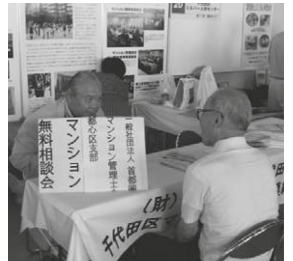
まちみらい千代田のコーナーでは、マンション管理の相談会も開かれました。

千代田区に住み、働き、学ぶ、多くの人たちが参加するイベント「福祉まつり」が、今年も10月12日に開催されました。11回目を迎えた今年のテーマは「つながよう みんなの手」。多くの団体などがボランティアで参加し、盛大に行われました。