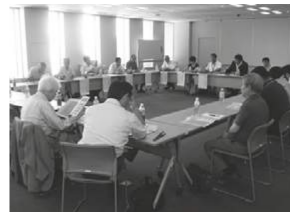
定期的に開催する連絡会では、毎回活発な意見交換が行われます。