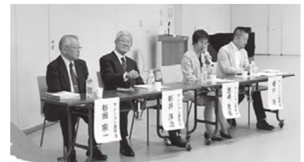
経験豊富な理事長さんたちのお話は、具体的に参考になります

マンション連絡会でいろいろなテーマを話し合い、交流してきた成果を披露することができました。