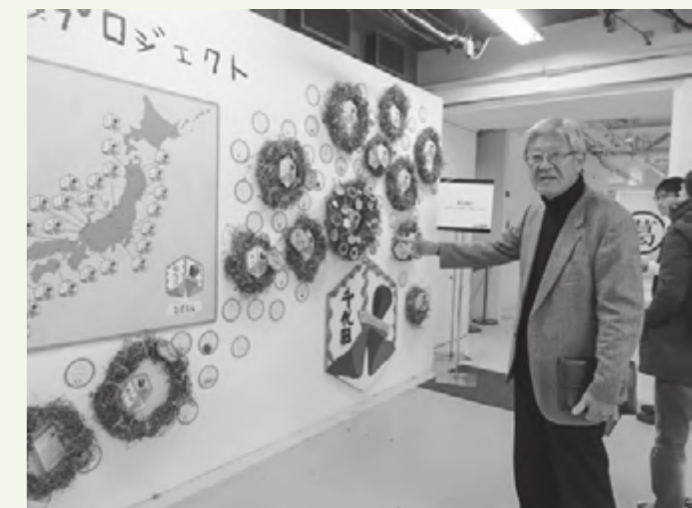
来年撒く種を取った後のアサガオのツルは、リースに再利用。3331を飾ったアサガオだけでなく全国各地から寄せられたツルのリースを説明する新井さん。