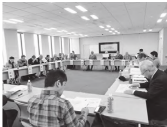
それぞれの管理組合の取り組みは、参加した皆さんにも共通したところもあり、情報共有がはかられます

次回の千代田区マンション連絡会は2月25日(土)2時から千代田区役所で開催します。